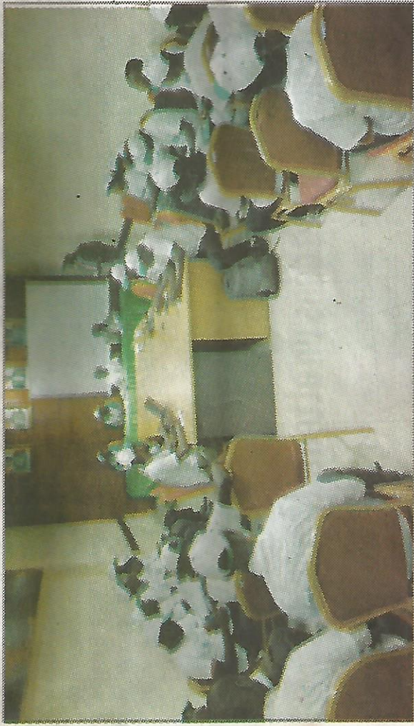
Une vue des participants à la Journée de sensibilisation, d'information et d'éducation à la lutte contre les plantes envahissantes.