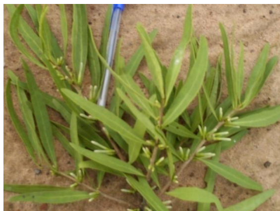
La figure 2 montre les feuilles et les boutons floraux d' Agelanthus dodoneifolius (D.C.) Polh et Wiens