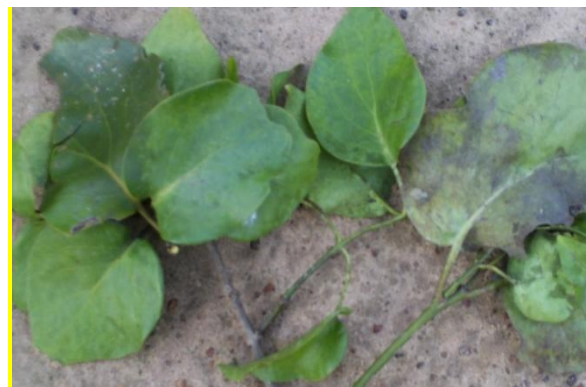
La figure 3 montre les feuilles de Tapinanthus bangwensis (Engl. et K. Krause) Danser